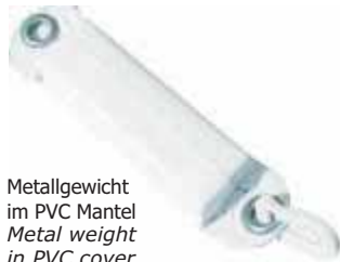
Metallgewicht im PVC Mantel Metal weight in PVC cover