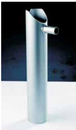
Auslegerschleifen Typ 76 Bomm slide type 76