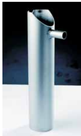
Auslegerschleifen Typ 90 Bomm slide type 90