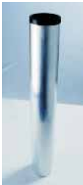
Bodenhülse Typ 76 Ground sleeve type 76