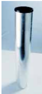
Bodenhülse Typ 90 Ground sleeve type 90