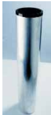
Bodenhülse Typ 100 Ground sleeve type 100