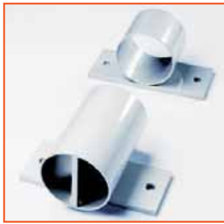
Wandhalterung 2-teilig Wall bracket, 2 pieces