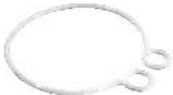
Mastschleufe Mast loop