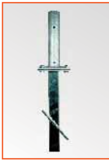
Kiphalterung, Stahl verzinkt Tilt bracket, galvanised steel